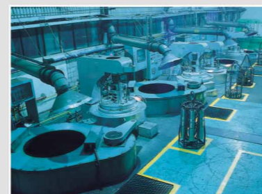
Unité de traitement thermique