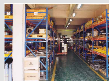
Stock Pièces détachées