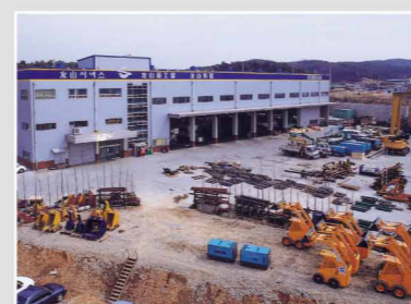
Centre de service